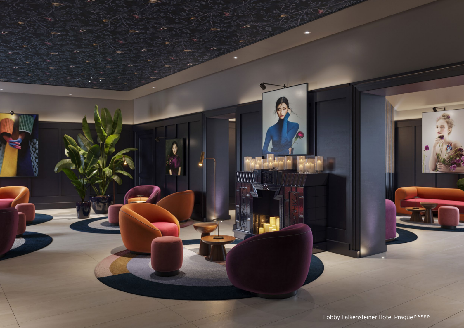
Lobby Falkensteiner Hotel Prague *****