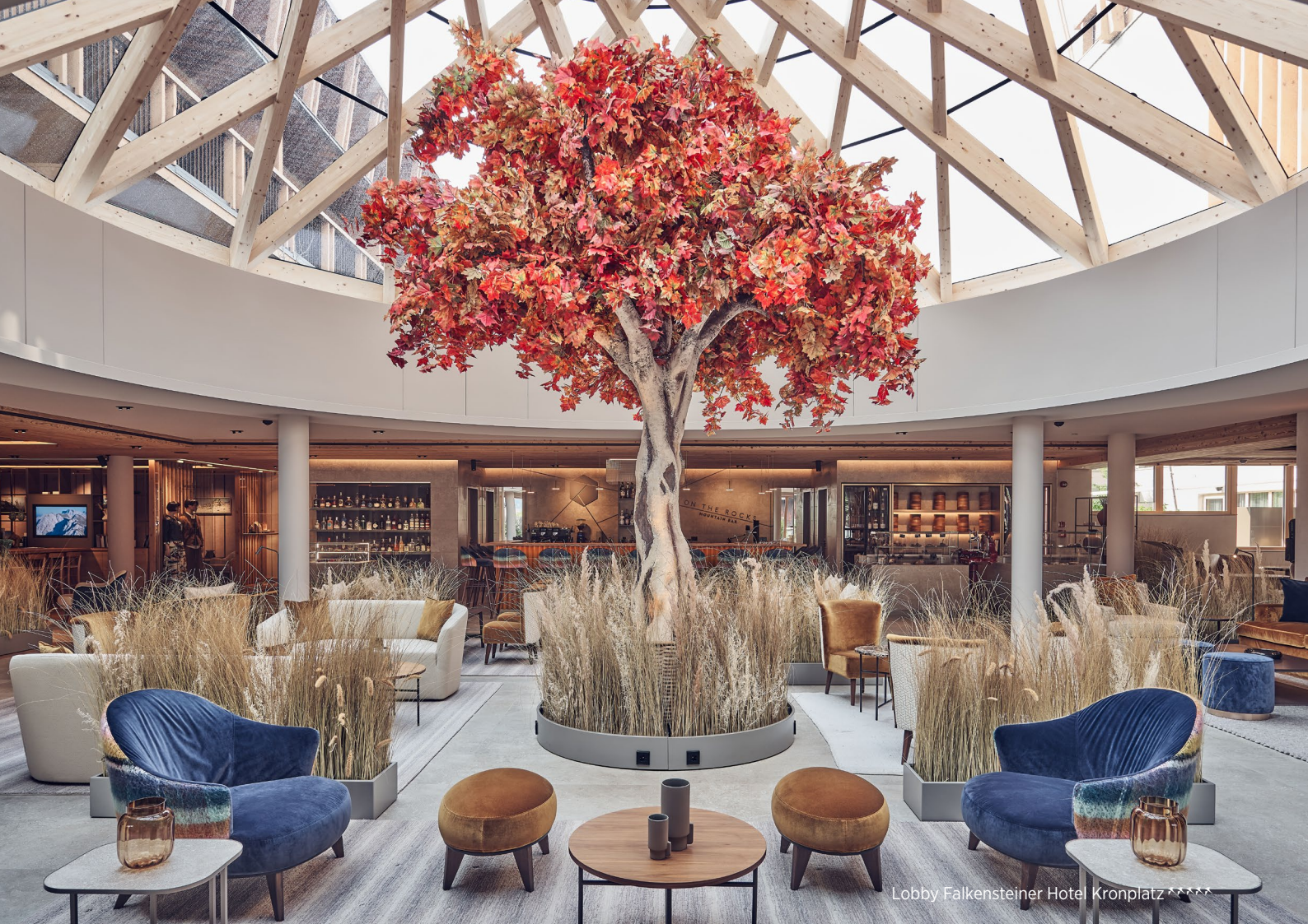
Lobby Falkensteiner Hotel Kronplatz